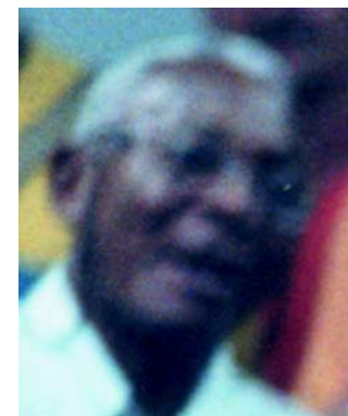
COORDENAÇÃO DE APOSENTADOS E PENSIONISTAS